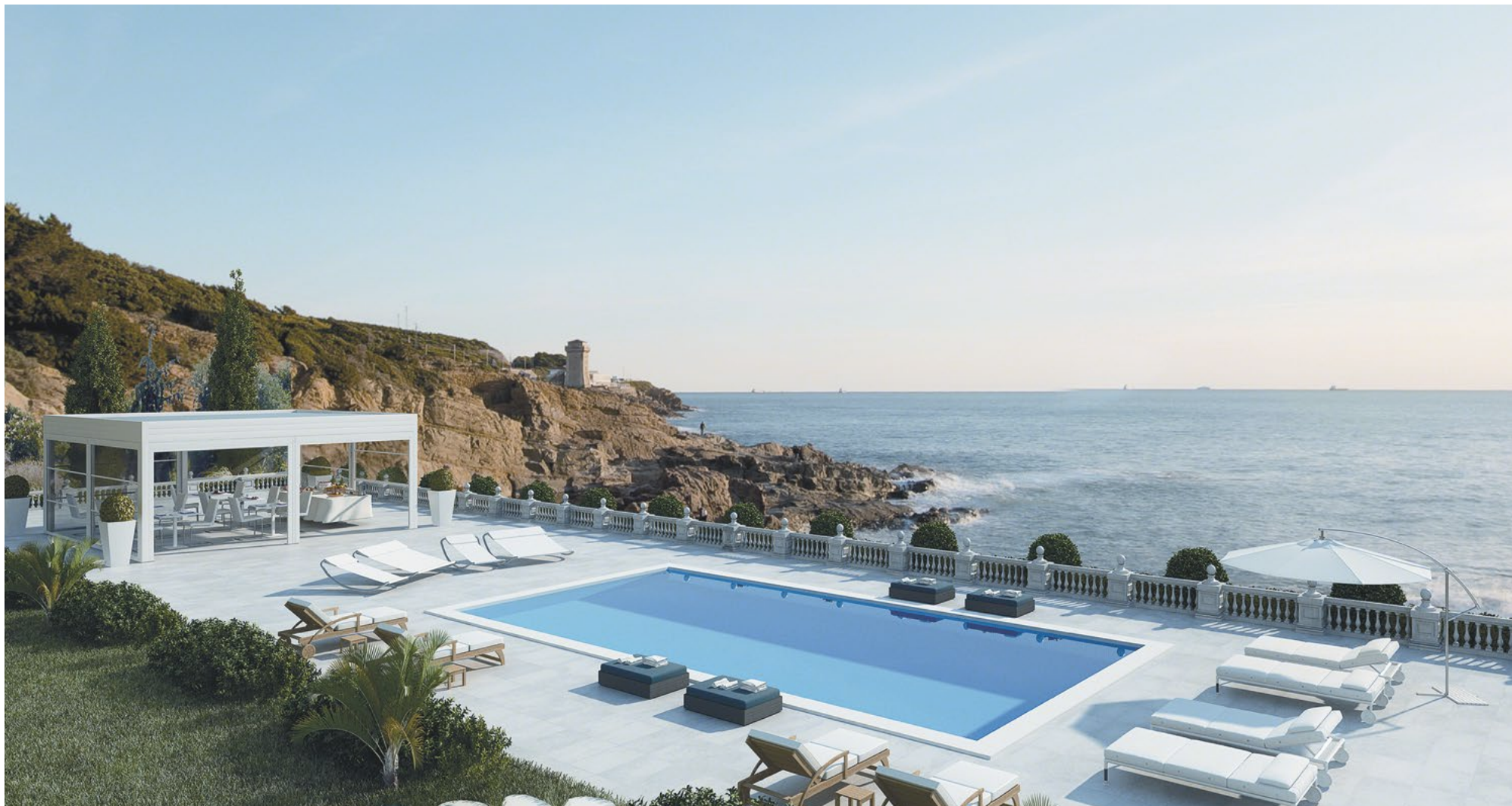
CRISTAL 650 CLEAR Gtot: 0,55