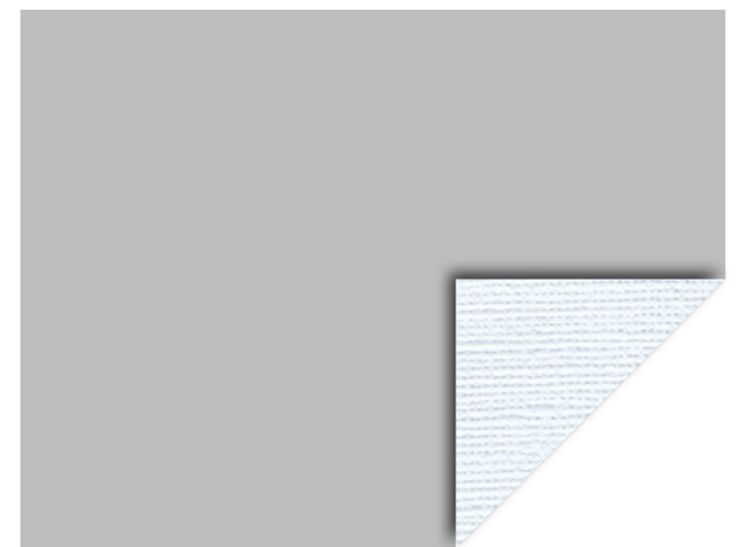
877 ext. Grigio scuro / int. Grigio chiaro Gtot int: 0,44 Gtot ext: 0,05