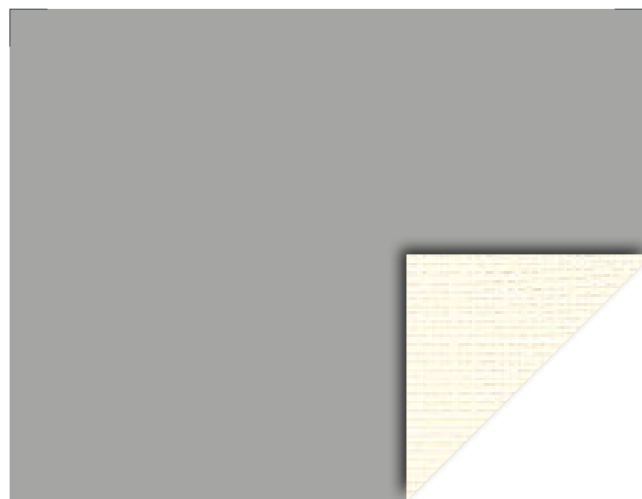
878 ext. Grigio / int. Champagne Gtot int: 0,44 Gtot ext: 0,05