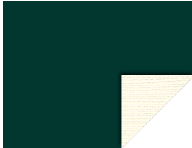
632 ext. Verde / int. Champagne Gtot int: 0,45 Gtot ext: 0,06